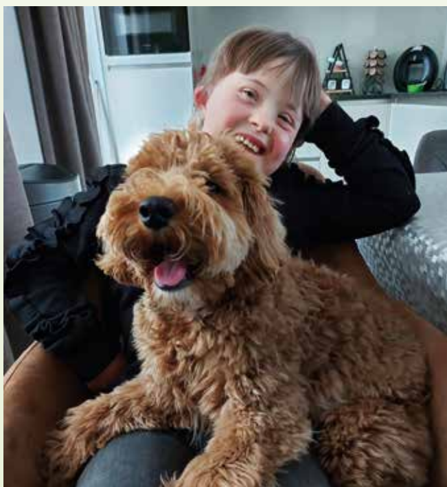
Ronja (12) en Bowe zijn de beste vrienden

https://pubmed.ncbi.nlm.nih.gov/37508697/